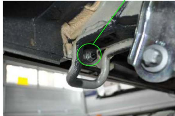
Detail: Verschraubung Stoßfängerunterbau