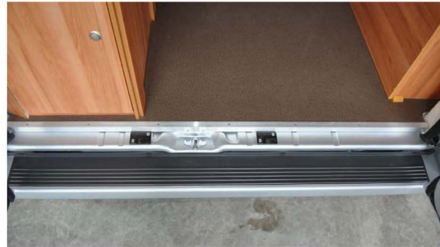
Aufgrund der eingebauten Adapter, lässt sich der Kunststoff- Stoßfänger nicht mehr ganz plan ans Fahrzeug schrauben. Dies wirkt sich jedoch nicht auf dessen Stabilität aus!