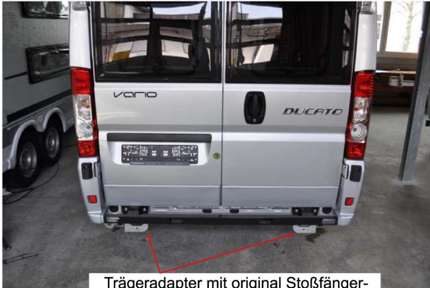
Trägeradapter mit original Stoßfänger- Unterbau wieder fertig montiert!