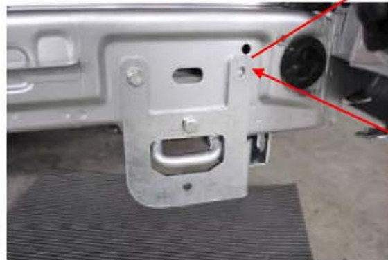
Adapter dient hierbei als Bohrschablone.